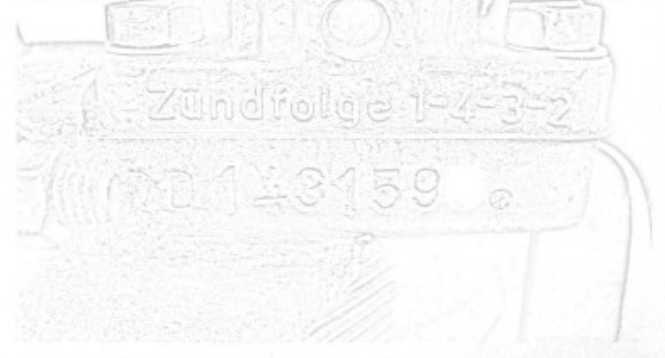
FOTO PUNZONATURA DEL NUMERO DI TELAIO

(foto ravvicinata e leggibile, eventuali prefissi e/o suffissi)